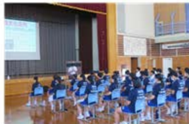
3年生高校説明会の様子

明日から三十二日間にわたる夏休みに入ります。配付されている「夏休みの生活」を再度確認し、安全・健全な夏休みにしましょう。ずっとONでは、疲れるし、せっかくの休みがもったいないです。かといつてずっとOFFでは、だらけるし、成長のない休みになってしまう。各自の計画に従い、ONとOFFを使い分けて、メリハリある毎日を送ってください。