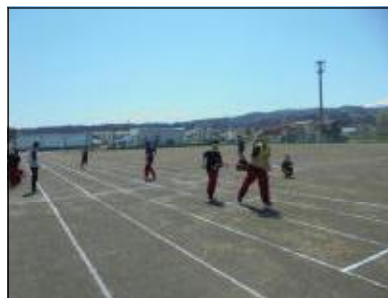
グラウンドでリレー練習