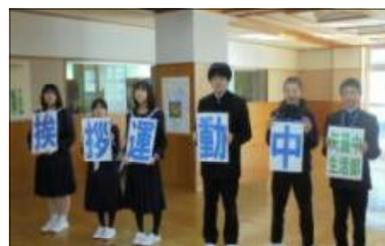
生活部の挨拶運動

元気なあいさつで明るい一日をスタートできるよう、生徒会執行部員と生活部員が中心となり、玄関ホールで朝のあいさつ運動を行っています。毎朝、登校してくる生徒一人一人に向けて「おはようございます！」という元気な声が響き渡り、玄関はさわやかな雰囲気になっています。あいさつは、人と人をつなぐ大切なコミュニケーションの第一歩です。これからも、互いに気持ちのよいあいさつを交わしながら、明るく温かな学校づくりを進めていきたいと思っています。