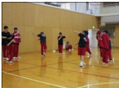
パフォーマンスの練習