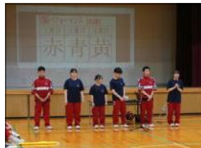
パフォーマンスの発表順決まりました