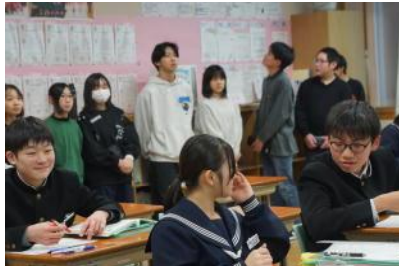
5校時：校舎見学・授業参観