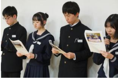
生徒会総務による学校紹介

1月30日（金）の午後、来年度入学する矢島小6年生と保護者の方をお迎えして、体験入学と入学説明会を行いました。全体会では、生徒会総務がスライドを用いて矢島中学校の学校紹介をしました。その後、保護者の方を対象とした携帯・スマホ使用に関する講話や入学説明会を行っている間、6年生は3班に分かれ、生徒会役員の引率で校舎見学と授業参観（1年保体・2年国語・3年社会）を行いました。6校時目には中学校の数学の授業を体験しました。「財産と借金ゲームをしよう」という課題で、トランプを使って正負の数について学びました。意欲的に学習に取り組むことができ、2ヶ月後の入学をとっても楽しみにしております。