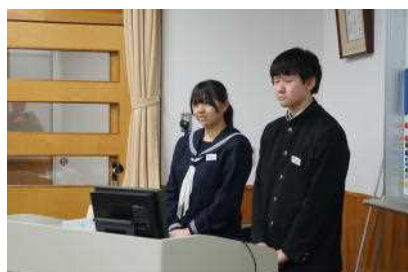
生徒会総務による学校紹介

1月31日（金）の午後、来年度入学する矢島小6年生と保護者の方をお迎えして、体験入学と入学説明会を行いました。全体会では、生徒会総務がスライドを用いて矢島中学校の1年間を紹介しました。その後、保護者の方を対象とした携帯・スマホ使用に関する講話や入学説明会を行っている間、6年生は3班に分かれ、生徒会役員の引率で校舎見学と授業参観（1年国語・2年数学・3年保体）を行いました。6校時目には中学校の社会の授業を体験しました。「日本とイタリアのブドウ栽培のちがい」についてみんなで考えました。社会の先生からは、「意欲的に学習に取り組み、協働的な学びができていた」と聞いております。2ヶ月後の入学をととても楽しみにしております。