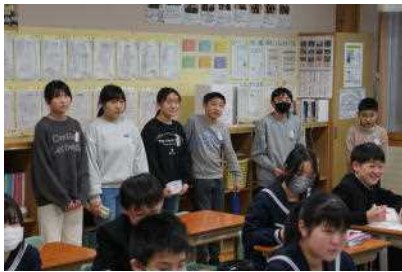
5校時：校舎見学・授業参観