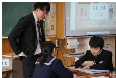
3年社会：大正、昭和時代