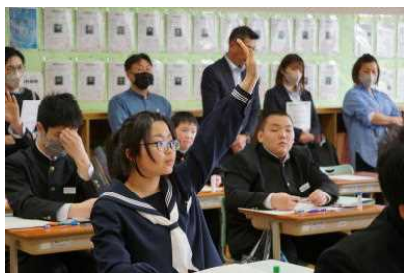
2年数学：多項式の加減法