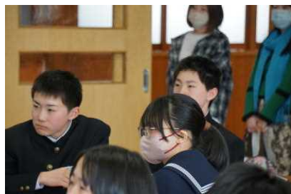
1年学級活動：個性の尊重

総会に先立って、15日(月)にPTA役員会が行われました。役員会では、三役員学年役員・各部役員が選出されました。今年度役員となりました皆様には、ご難儀をおかけいたしますが、ご支援・ご協力宜しくお願いいたします。