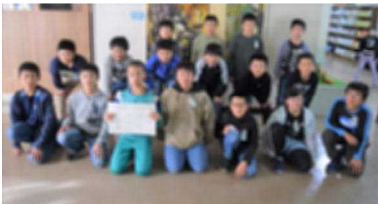
【鶴舞野球スポ少のみなさん】