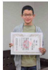
【感想文：推薦の小西さん】

ゆめ画 ◎第51回本荘由利未来の科学ゆめ画展 由利本荘市長賞 2年 三浦 AAB秋田朝日放送局長賞 1年 佐藤