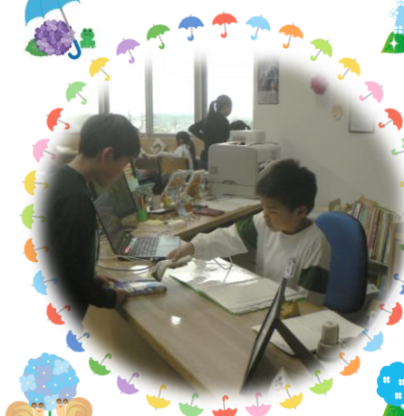
イベント当番のようす (ポスター作成)