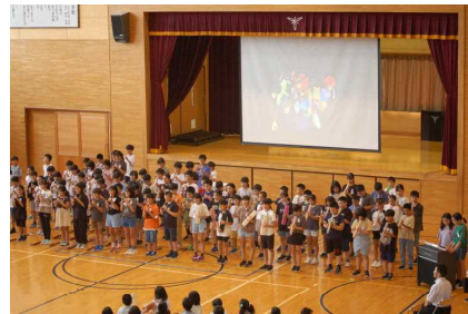
5年「ルパン三世のテーマ」