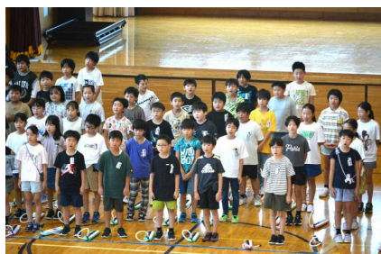
4年「いろんな木の実」

どちらの音楽集会も各学年からの感想発表もとてもすばらしく、みんなが笑顔になるすてきなひとときでした。次回は、10月22日(火)、2年生の発表の予定です。