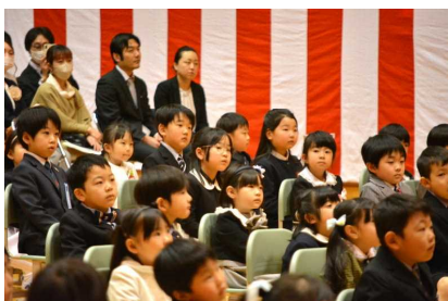
【しっかり聞いています】