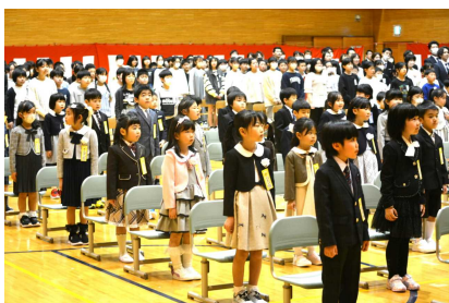
【立派に起立しています】

これで、令和6年の新山小学校、 全校児童610名、職員54名 がそろいました。職員一同、子どもたちに寄りそい、支え、各家庭・地域の皆様と力を合わせて子どもたちの健やかな成長のために全力を尽くしてまいります。