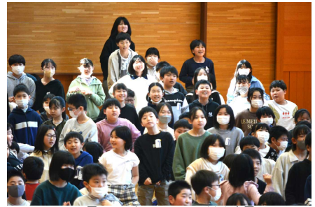
【担任発表のときの子どもたち】

子どもたちの健やかな成長のため、今年度も、各家庭、地域の皆様のご支援をよろしくお願いいたします。