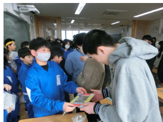
【4年生からフォトフレーム】