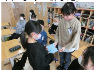
【2年生からメッセージカード】

3月7日（木）の朝活動の時間、2～5年生が縦割り班の6年生にプレゼントを渡しました（1年生は、2月22日の6年生を送る会のときにメダルをプレゼントしています）。2年生はメッセージカード、3年生は鉛筆立て、4年生はフォトフレーム、5年生はしおりを心を込めて作りました。学年入れ替わりで6年生の教室を訪れ、下級生が「今までありがとうございました。中学校でもがんばってください。」などと言ってプレゼントを渡すと、6年生も「立派な〇年生になってね」「〇年生になってもがんばってね」「あいさついっぱい为学校にしてください」などと返していました。プレゼントをもらった6年生は、とてもうれしそうにしていました。