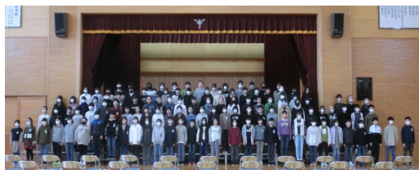
【ひな壇で呼び掛け練習を行う6年生】

卒業生の保護者の皆様には、6年間、本校の教育活動に対しまして、ご理解とご協力をいただいたことに、心より感謝申し上げます。当日は、小学校生活6年間の集大成となる立派な姿をお見せできることと思います。どうぞご期待ください。