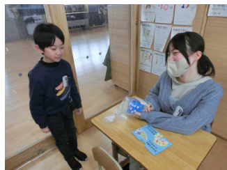
【3年生から鉛筆立て】