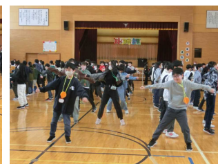
【6年生 切れ味のよいダンス】