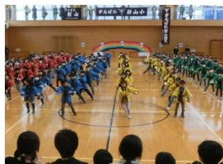
【2年生 元気いっぱいダンス】