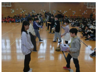
【児童委員会の引き継ぎ】