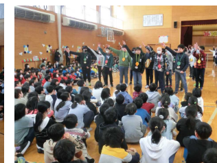
【3年生へエールを送る6年生】