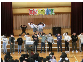
【5年生 思い出ベスト5・寸劇・ダンス】