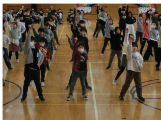
【3年生 かつよく決まったダンス】