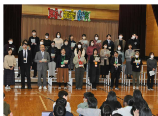
【職員 合唱・エール】