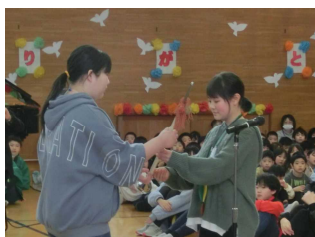
【6年生（右）から5年生へ指揮杖の引き継ぎ】