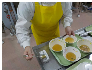
【⑥汁の味見と塩分測定】