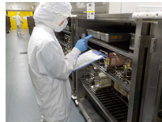
【⑪食器・食缶の確認】