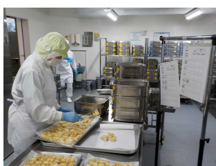
【⑨きりたんぼの数を数えて食缶へ配食】