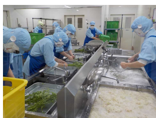
【②セリ（左）、切り干し大根（右）を3回洗浄】