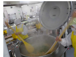
【④切り干し大根を炒める】