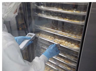
【⑧蒸したきりたんぼの温度を測定】