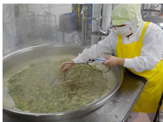
【⑦汁完成時の温度測定】