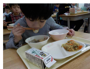
【きりたんぼをほおぼる3年生】

新山小学校の給食は、「由利本荘市北部学校給食センター（由利本荘市岩谷町字日渡85）」でつくられています。対象となっている学校は、新山中・鶴舞小・岩城小・岩谷小・大内小・本荘北中・岩城中・大内小・尾崎小（尾崎小は米飯のみ）です。給食センターの28人の調理員さん・配送員さんが、約2,400食のおいしい給食を毎日つくってくれています。以下に、1月23日（火）の給食ができるまでの作業内容を簡単に紹介します。この日のメニューは、「ご飯・切り干し大根のカレー炒め・きりたんぼ汁・味付けのり・牛乳」でした。