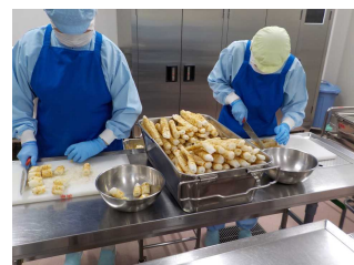
【③きりたんぼをカット】