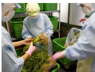
【①セリの状態を確認】