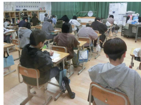
【県学習状況調査に真剣に取り組む6年生】

それぞれの学年の子どもたちは、難しい問題でも諦めずに粘り強く取り組んでいました。結果が届きましたら、子どもたちが苦手としている部分を復習したり、授業改善に役立てたりしていきます。今年度の復習をしっかりとやって、進級・進学できるようにがんばっていきます。結果は、後ほどお知らせします。