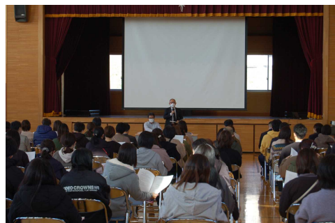
【PTA臨時総会で説明するPTA会長さん】

臨時総会の議題は、PTA会則の改正についてでした。まず最初に、改正案を提案することになった経緯について、PTA会長さんより説明がありました。現行の会則（平成26年3月改正）では、総務部員を務めた方は3年間、理事会員を務めた方は2年間、学級委員を務めた方は1年間の役員に選出されない権利を有します。しかし、2年おきに学級委員に選出されるなどの不公平感をもつ方もおり、いろいろな方に役員を経験してもらった方がよいというご意見が理事会で出されました。そして、PTA組織や選挙の在り方について、次のような案が提案されました。