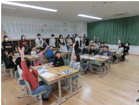
【3年1組の授業の様子】

この改正案は、満場一致で承認されました。来年度のPTA活動は新たな組織でスタートすることになりますが、保護者の皆様と教職員が協力して子どもの健やかな成長を図るという活動の目的は変わりませんので、これからもよろしく願いいたします。（現在、権利の有無にかかわらず、全ての保護者の皆様に令和6年度の権利行使の確認書の提出をお願いしております。提出期限は12月20日ですので、ご協力をお願いします。）