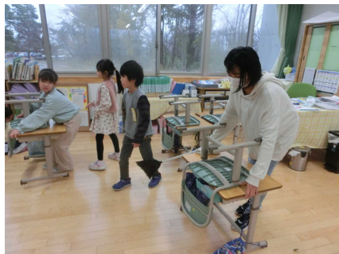
【机を運ぶ6年生（右）と1年生】

6年生は下級生のお手本になるように率先して清掃に取り組み、下級生は6年生の姿を真似ながら真剣に活動していました。