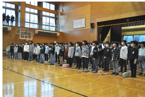
【5・6年合唱 Wish ～夢を信じて～】