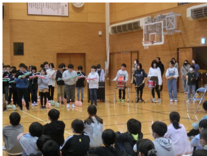
【5年合奏 キリマンジャロ】

2 もしも願いが叶うのなら 僕の両手に勇気をください 夢を信じて歩き出す 強い気持ち持っていたいから 柔らかな日差し 愛にあふれて 全てが輝き生きてる 季節はめぐって大地を飾ってゆく 光と風と空の青さを写して