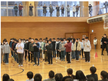
【6年合奏 ラバースコンチェルト】