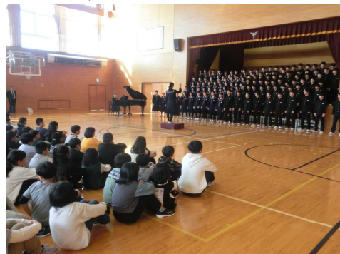
【中学生の歌声に聴き入る5・6年生】