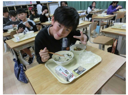
【入部400年記念給食をおいしくいただく6年生】