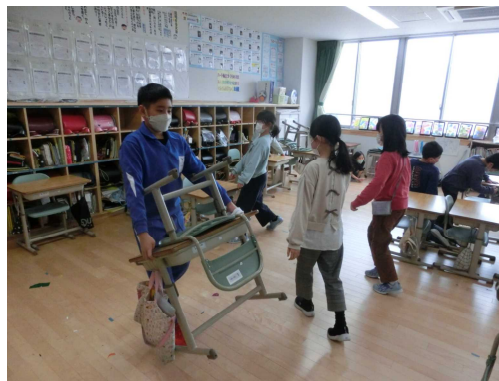
【率先して机を運ぶ6年生】