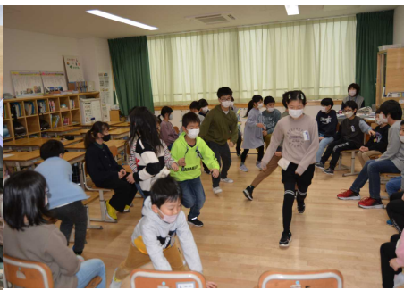
【フルーツバスケット】