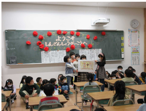
【椅子に座って紙芝居を見る年長さんたち】