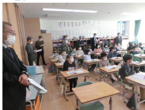
【4年2組の授業を参観する委員の方々】

委員の皆さんからは、「子どもたちが、明るく伸び伸びと活動していた。」「校舎が南向きで明るく、子どもたちは意欲的に学習していた。環境は大切だと思った。」「6年生のクラスで、先生が背伸びをして黒板の上部に文字を書こうとしたときに、子どもから『がんばれ！』という声があり、ジーンとした。」「リニューアルした図書室に感心した。前よりよくなった。」などの声がありました。