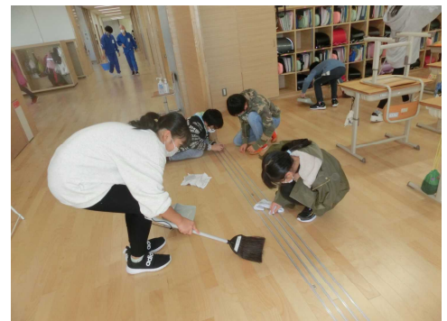
【レールの溝をきれいにする子どもたち】

どの学級でも改善点を考え、◎が増えるようにがんばりながら、学校も心もピカピカに磨くことができました。