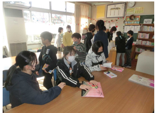
【オープン直後から大盛況となった図書室】