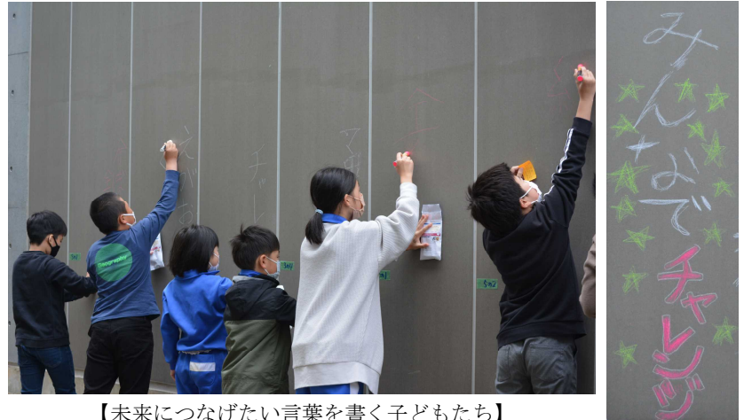
【未来につなげたい言葉を書く子どもたち】

子どもたちが学校の未来像を考えることで愛校心を育み、心に残る思い出つくることを目的に行いました。言葉については、各学級で話し合っ