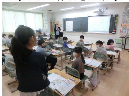
【新しい教室で学習(4年1組)】