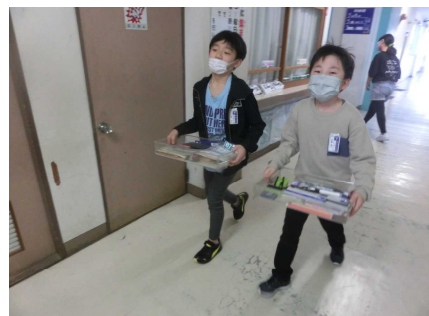
【がんばって荷物を運ぶ6年生】

そして、17日(月)から新たな生活が始まりました。新しい生活の約束なども確認し、新たな生活にも徐々に慣れてきています。新山小学校の新たな歴史がスタートしたところです。