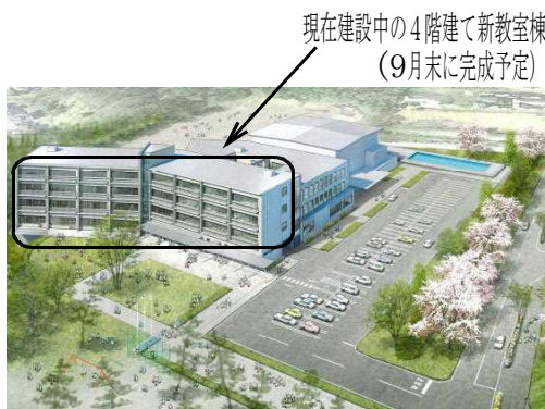
【新校舎完成予想図】