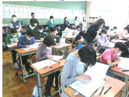
【真剣に学習に取り組む6年生】

1年生の子どもたちは、小学校生活最初の授業参観のため、授業が始まる前はかなり興奮していましたが、授業が始まると次第に集中して取り組んでいました。また、他の学年でも真剣に学習に取り組む姿が見られ、新しい学年でがんばるお子さんの様子をご覧いただけたとも思います。