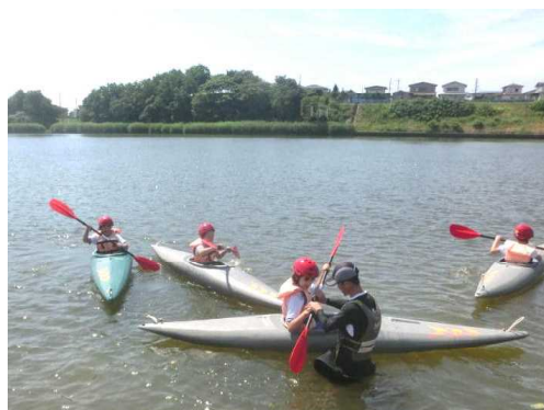
【4年4組カヌー教室 7月5日】

カヌー教室は、平成11年度から実施しており、新山小学校の伝統的な学習になっています。2020東京オリンピックカヌー競技に出場した小野祐佳選手もこの教室がきっかけでカヌーを始めたと聞いています。