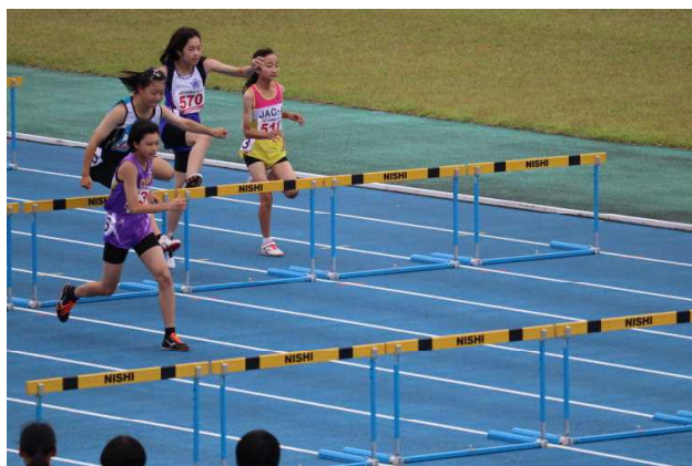
←出場選手 ↑80mハードル(コンバインドA)

全国小学生陸上競技交流大会は、9月22日(日)に、東京都の国立競技場で開催されます。