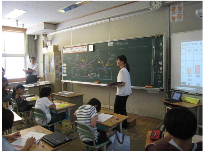
(5年松組社会のまとめの様子)