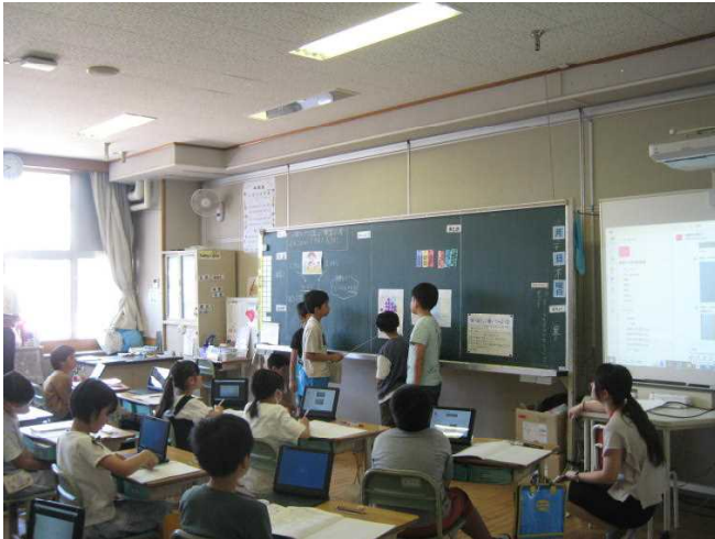
(4年竹組算数の発表の様子)

6月20日（木）、今年度初めての校内授業研究会が開催されました。提示された授業は、4年竹組算数、5年松組社会です。4年生の算数では、小数の足し算について、1/10、1/100の位をもとにすることで、整数の足し算と同じように計算できることを自分たちで発見することができました。5年生の社会では、暖かい地方の暮らしを探るため、沖縄県の気候や産業、人々の暮らしについて調べ、その特徴をまとめることができました。どちらの学級も子どもたちが主体的に調べ、生き生きと学び合う姿がすばらしかったです。