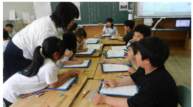
(2年松組の授業の様子)