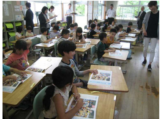
(1年梅組の授業の様子)