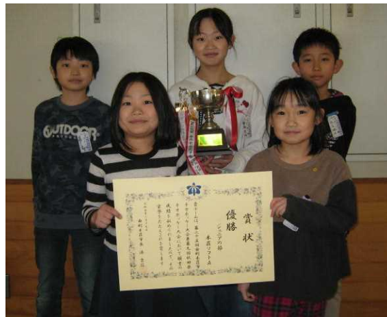
写真はU-10 ※U-12の写真は後日、掲載