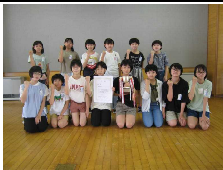
←優勝した女子チーム

○6月19日（日）第45回秋田県スポーツ少年団サッカー交流大会に、地区代表として、本荘南サッカースポ少U-12が出場しております。