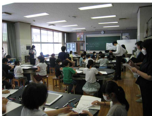
(5年梅組 理科の授業)