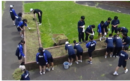
2年生の作業の様子