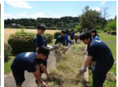
3年生の作業の様子