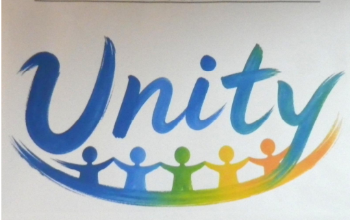
令和8年度大内中学校生徒会スローガン

その中で、今年度の生徒会のスローガンが発表されました。各活動でUnityを達成できるよう皆で頑張りましょう。