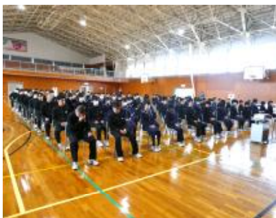
集会オリエンテーション