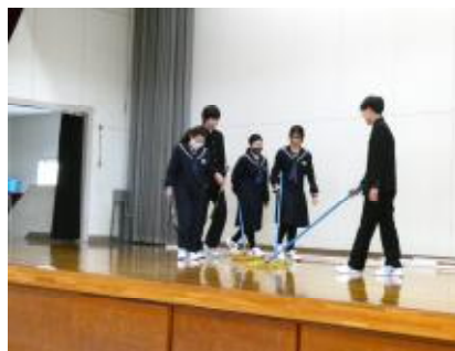
清掃オリエンテーション