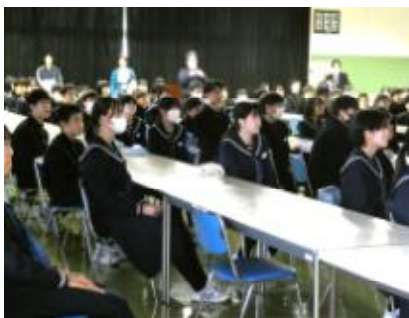
給食オリエンテーション

新任式、始業式、入学式も無事終了し、大内中学校の活動が本格的にスタートしました。学活、各種オリエンテーション、1期ガイダンスなど新入生だけでなく、2・3年生にとっても慌ただし4月前半が過ぎました。これらの学活や集会を基に、全校で決まり事や方針を理解し、快適な学校生活が送れるよう、行動していきましょう。