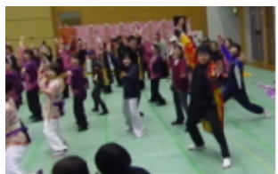
3年生よさこい総踊りに参加

「おおうち春まつり」に参加した6,000人の皆さんへ大内地域の元気を、大中学生の地域貢献にける情熱を感じていただくことができたのではないかと思います。ありがとうございました。(↓下のQRコードから当日の様子をご覧くださいませ。)