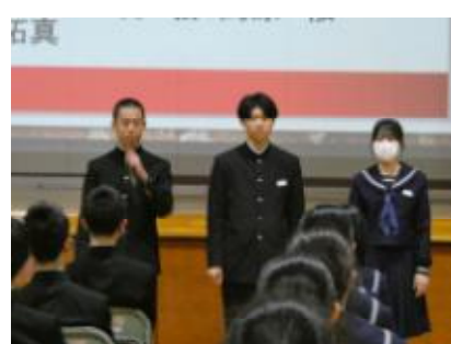
1期ガイダンス(生徒会)