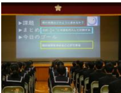
1期ガイダンス(学習)