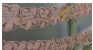
◎CHERRY BLOSSOM STREET◎

4月11日(土)の本番、科学部のブースではバスボールとスライムづくりにお子さんから大人まで大勢の皆さんが体験していました。吹奏楽部の昭和から令和までのヒット曲の演奏に聴衆の拍手が起こりました。そして、大内音頭の輪踊りに科学部、吹奏楽の皆さんが参加し、地域の皆さんと会場を盛り上げました。また、サブアリーナに通じる廊下には生徒、教職員が書いたメッセージが掲示されました。さらに、物販販売のボランティアの皆さんの活躍で、公式グッズのうちわを完売し、5万円の売り上げになったそうです。最後の総踊りには3年生の数名が踊りの中に加わり、まつりのフィナーレを盛り上げてくれました。