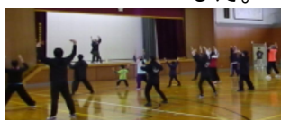
よさこい総踊り練習会

残念ながらボランティアへの応募者が少なく、清掃ボランティアは中止となり、まつり当日のボランティアの実施も危ぶまれました。しかし、吹奏楽部が午後からボランティアであれば、参加できる状況にあることが分かり、再度募集したところ、2年生8名が物販販売のボランティアに応募してくれました。