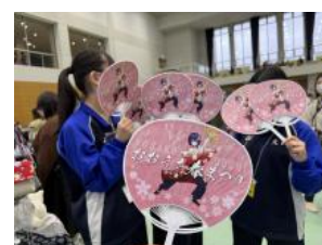
2年生物販販売ボランティア

4月11日(土)の本番、科学部のブースではバスボールとスライムづくりにお子さんから大人まで大勢の皆さんが体験していました。吹奏楽部の昭和から令和までのヒット曲の演奏に聴衆の拍手が起こりました。そして、大内音頭の輪踊りに科学部、吹奏楽の皆さんが参加し、地域の皆さんと会場を盛り上げました。また、サブアリーナに通じる廊下には生徒、教職員が書いたメッセージが掲示されました。さらに、物販販売のボランティアの皆さんの活躍で、公式グッズのうちわを完売し、5万円の売り上げになったそうです。最後の総踊りには3年生の数名が踊りの中に加わり、まつりのフィナーレを盛り上げてくれました。