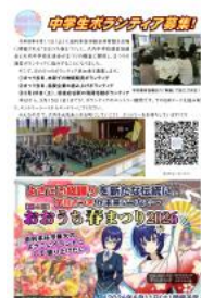
ボランティア募集

そして、今年1月末に行われた、第3回学校運営委員会の中で、委員、教員、保護者、生徒会総務が参加して行われた熟議に、おおうち春まつり実行委員4名の皆さんにも参加していただきました。そのなかで、大内地域の活性化に向けて、地域住民と生徒が自分たちのできることでおおうち春まつりに貢献することへの賛同が得られました。