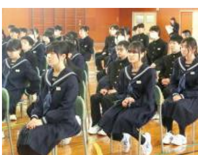
1期ガイダンス(生活)