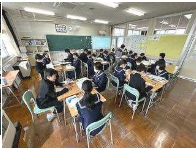
2A国語「作者が伝えたかったことは何だろう」