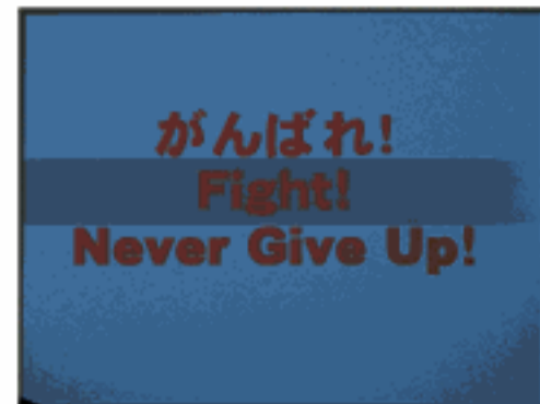
3年生からのエール