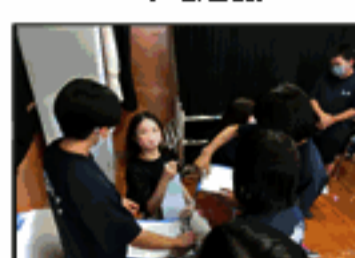
職業講話・講師に質問