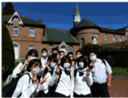
トラピスチヌ修道院