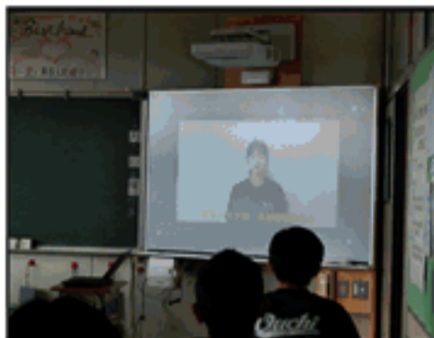
3年生からのエール