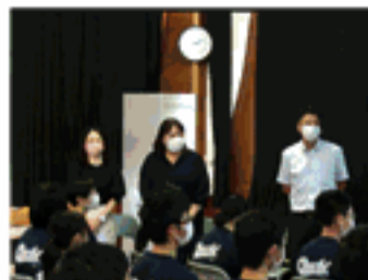
保護者による職業講話