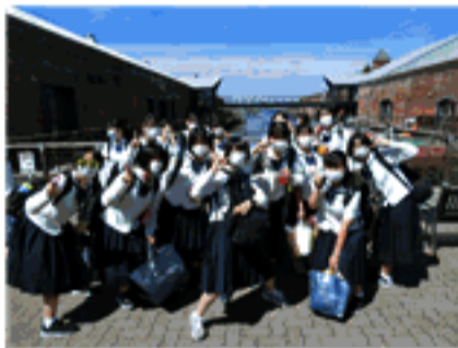
函館・金森倉庫にて