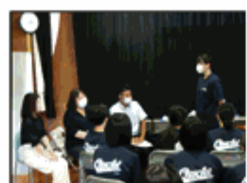
職業講話・お礼の言葉