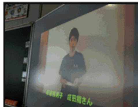
3年生からのエール