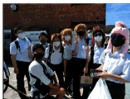
人カ車のタフマンと一緒に