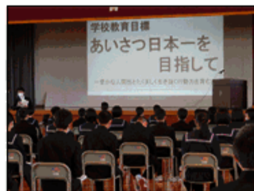
「学校教育目標の確認」