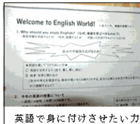
英語で身に付けさせたい力