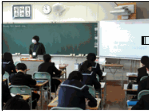
1 B 英語の授業