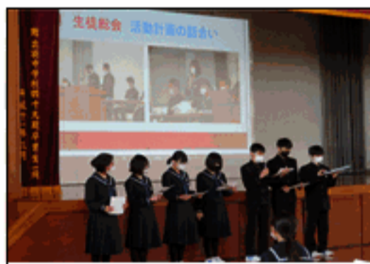
生徒会の組織、行事について