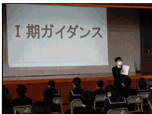
I期ガイダンス・学習