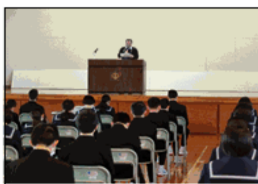
I期ガイダンス・生活