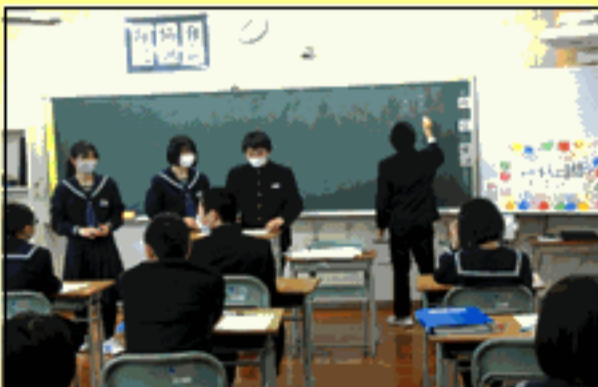
3 A 学級活動