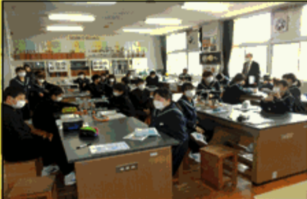
1 A 理科の授業