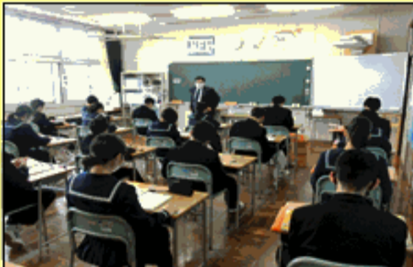
2 B 数学の授業