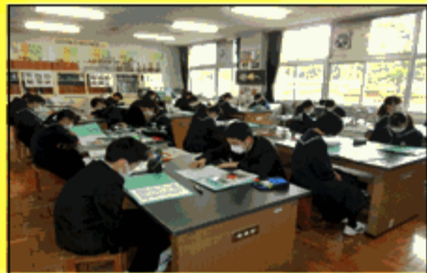
2 A 理科の授業