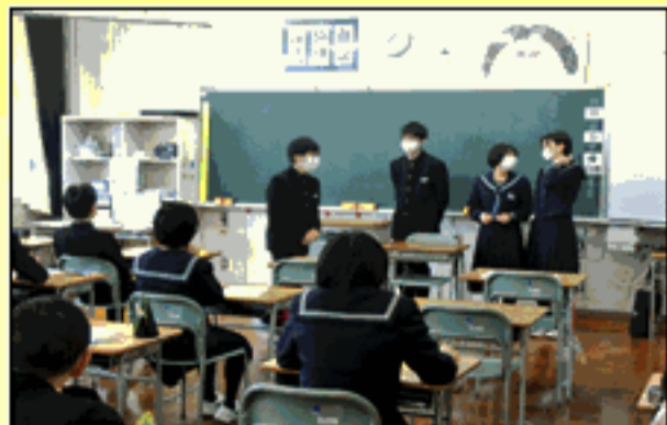
3 B 学級活動