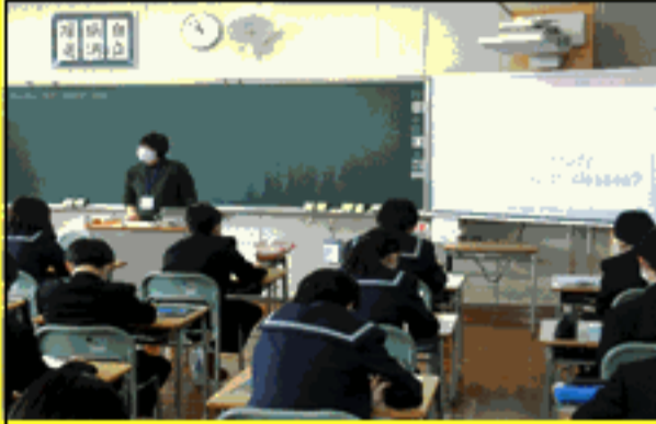
1 B 英語の授業

◇いよいよ授業が始まりました。大中の強みである対話的・協働的な学びを発展させましょう。