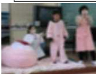
5年：保健「心の健康教室」