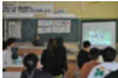
6年：家庭科「感謝の気持ちをつたえよう」