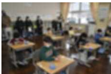
1年：算数「かたちづくり」

13日(木)は今年度最後のPTA参観日・全体会でした。インフルエンザや風邪が流行し、心配しましたが無事に行うことができよかったです。授業参観では、今年1年間の成長した子どもたちの姿がありました。また、6年生は卒業を祝って茶話会、5年生は外部講師を招いての心の教室、4年生は10歳を祝う会と学年の行事を行い、1年間の締めくくりとなりました。全体会では、今年度のPTA事業とPTA会計の中間報告をさせていただきました。また、学級懇談も行うことができ有意義なPTA参観日となりました。お忙しい中、参加してくださりありがとうございました。