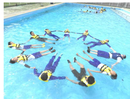
こんなこともできました