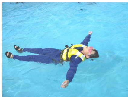
救命胴衣を付けると簡単に浮くことができます