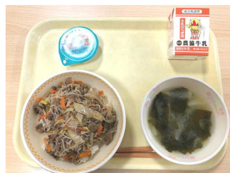
「秋田由利牛のすきやき丼」

北部学校給食センターでは、全国学校給食週間の期間中、秋田県や由利本荘市の食材を使った給食を実施しました。24日の給食は「秋田由利牛のすきやき丼」でした。秋田由利牛のすきやき丼の牛肉は、秋田由利牛振興協議会様より一部無償で提供していただいた「秋田由利牛」を使用しています。また、26日（金）は大内の「絹さやうどん」でした。子どもたちは自分たちの大内地区の特産品が給食に出て、どこか誇らしげでした。郷土の食文化を知る大切な機会となった「全国学校給食週間」。おいしい給食にみんな大満足でした。