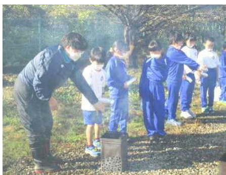
「校務員さんをお願いして」