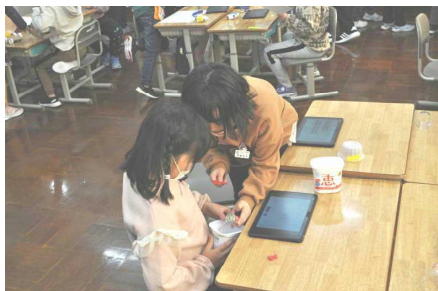
「改良するところは？」