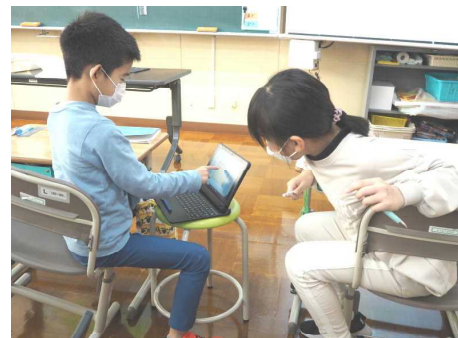
「書き込んだ考えを説明」