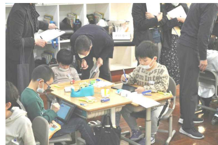
「タブレットに今日の振り返り」