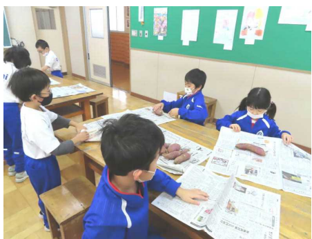
「新聞紙でくるんで準備」

1年生と2年生が世話をしてきたサツマイモ。今年は大豊作で、大きなサツマイモをたくさん収穫することができました。「掘ってから2週間ぐらいすると甘くなるんだよ。」と2年生のみなさん。十分に甘くなった14日（月）に焼きいもを1年生と2年生が協力して行いました。