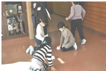
「おもちゃの動きを試してみて」