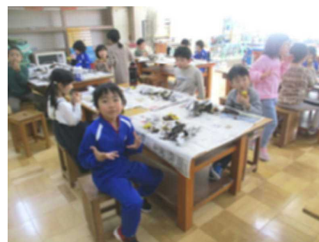
「とってもおいしい焼きいも！」