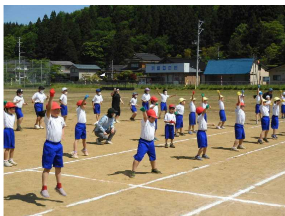
かわいいダンスにアンコール！