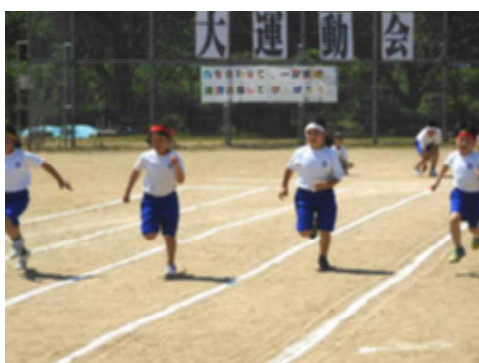
全力で駆け抜けた100m