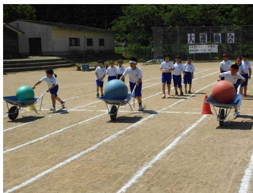
大玉 一輪車 レッツゴー