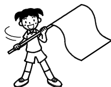
気持ちを一つに バランスリレーパート2