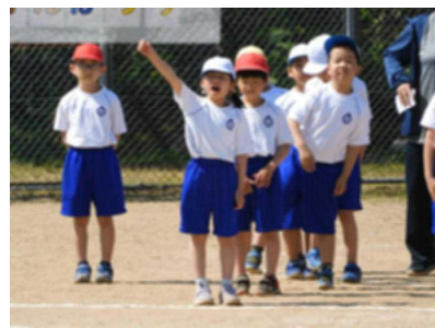
しっかり返事をして一般走