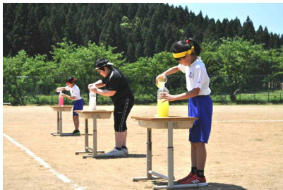
エネルギー満タン!