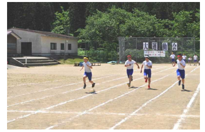
力強い走りの高学年100m走