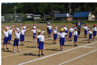
ラジオ体操もがんばります！