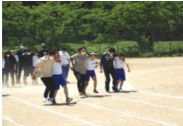
これが最後 親子スキップ競争