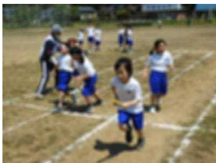
上手にバトンパス！