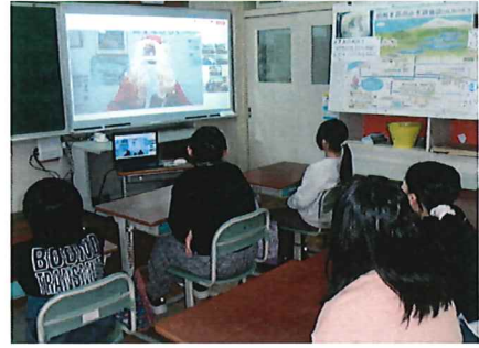
教室でオンライン集会

本日12月25日は、体育館ではなくオンラインで冬休み前集会を行いました。子どもたちは明日から1月13日(月)までの冬休みに入ります。集会では、「家族団らんを大切に、おうちの人と色々なお話をしてほしいこと」「来年はどんな年にしたいのか、目標や願いを持つこと」の2つの話をしました。お正月休みではお子さんとゆっくり会話を楽しんでください。1月14日(火)には、子どもたちの元気な姿を見ることを楽しみにしています。それではどうかよいお年をお迎えください。来る新年も宜しくお祈りします。