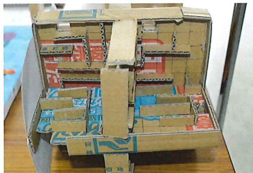
段ボールで立体迷路を作成しました