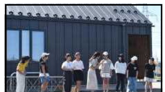
あらまつりで踊る音楽クラブ