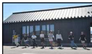
あらまつりで踊る音楽クラブ