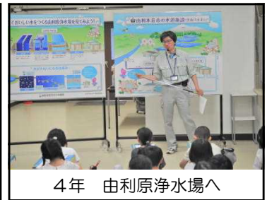
4年 由利原浄水場へ