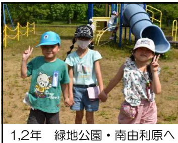
1,2年 緑地公園・南由利原へ

7月5日（水）に、1、2年生が由利町の緑地公園と南由利原へ、4年生が、由利原浄水場に行ってきました。暑い中でしたが、しっかりと学びました。