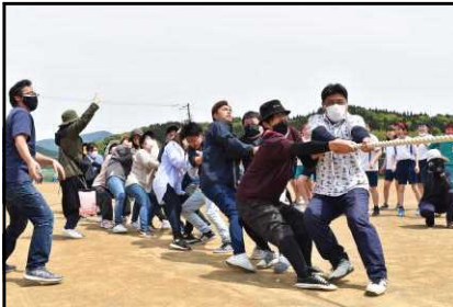
PTA種目（優勝した6年部）