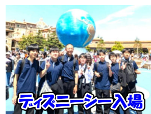
ディズニーシー入場