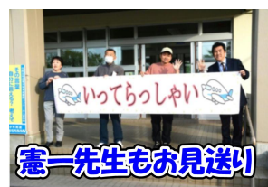
憲一先生もお見送り