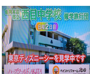
由利本荘市立 西目中学校 修学旅行団 日程2日目 東京ディズニーシーを見学中です ハブワールドAKITA