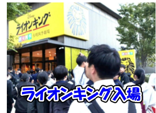
ライオンキング入場

3日目は、ホテルから貸し切りバスで国会議事堂へ向かいました。日本の政治の中心となる国会議事堂では、緊張気味に傍聴席に座るようすが見られました。その後、浅草散策や昼食、上野公園での見学と天気にも恵まれ無事日程を終え、ほぼ予定通りの20:30に帰校しました。