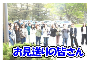
お見送りの皆さん