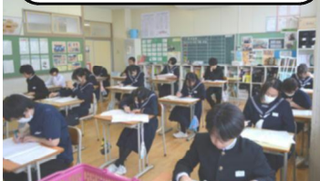
1年A組：計算領域テスト