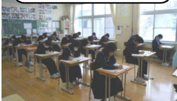
2年A組：県学習状況調査