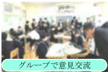
グループで意見交流