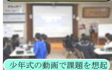
少年式の動画で課題を想起