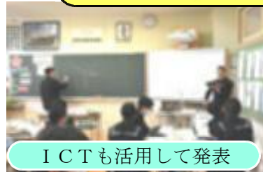
I C Tも活用して発表