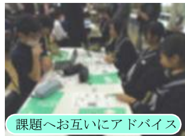
課題へお互いにアドバイス