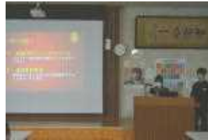
2 A ＊＊＊＊＊さん