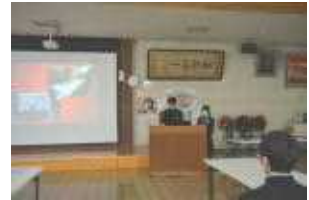
2 A ＊＊＊＊＊さん