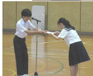
ポスター図案作成の3A 蘆****さんに感謝状

この日を迎えるにあたり、生徒会総務を中心に3年生が各部門のリーダーとなって、地区総体が終わった6月28日から準備に取りかかりました。今年の夏は暑い日が続き、夏休みの活動も制限されるなど、計画通りに進まなかった点もありましたが、限られた時間の中で練習や準備に取り組んできました。