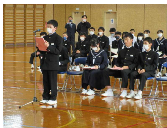
【朝のあいさつ運動の様子】

学校の主役は、生徒一人一人であるという考え方を大切にし、学校生活をさらに向上させるため、みんなで協力して活動していきましょう。各委員会の主体的な活動に期待しています。