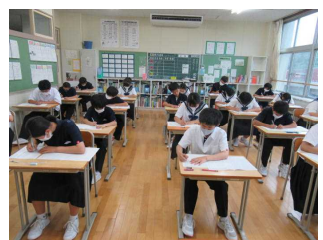
【1年生初めての中間テスト】

テスト終了後は、回復学習を確実にを行い、次の目標を決めて、書き出して、前に進んでいきましょう!