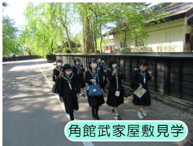
角館武家屋敷見学

「ACTIVE!～みんなが修学旅行を楽しめるように～」は3年生が設定した修学旅行のテーマです。5月10日(火)から11日(水)まで1泊2日の日程で、3年生が修学旅行に行ってきました。昨年度の生徒・保護者アンケート結果から、PTA三役・学年部長及び学校運営協議会会長・副会長と協議の上、今年度も昨年度同様に県内での実施、そして同じコースでの修学旅行となりましたが、最高の五月晴れの下で、秋田県の魅力を再発見した思い出深い貴重な2日間となりました。