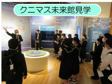
クニマス未来館見学