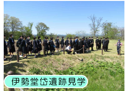
伊勢堂岱遺跡見学