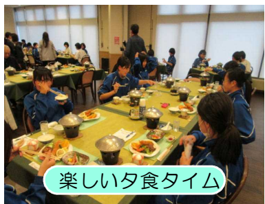
楽しい夕食タイム